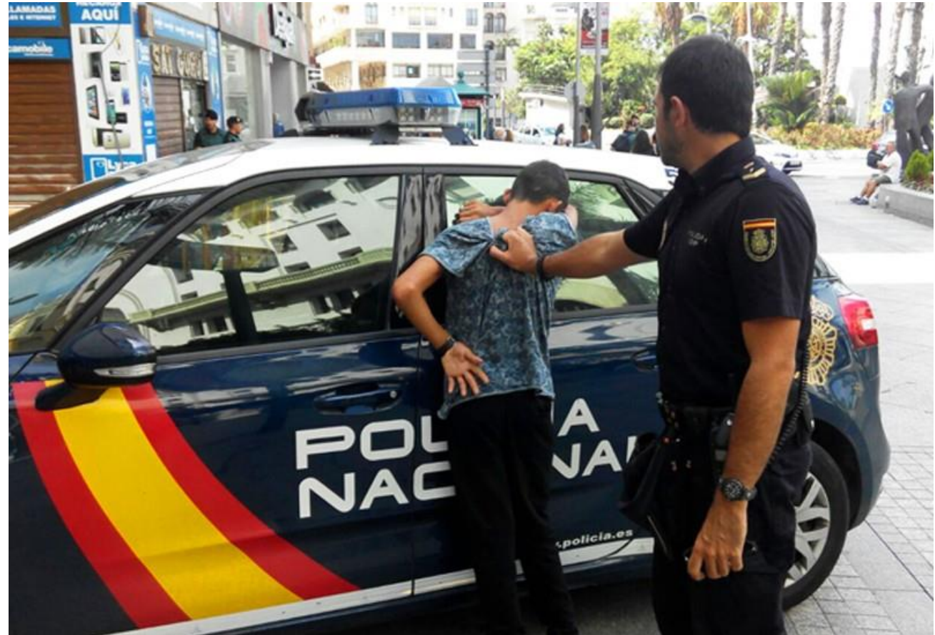
El Pueblo de Ceuta