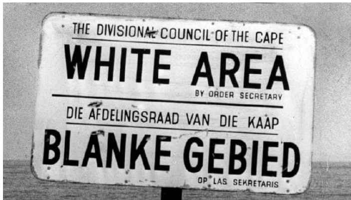
Afrique du Sud, apartheid de 1948 à 1990