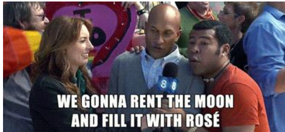
(Key & Peele, cómicos estadounidenses)